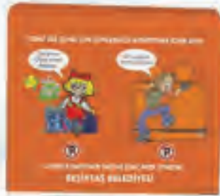
C 158 Evsel Atık Toplama Merkezi