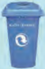
Rİ 212 Geri Kazanım Konteyneri