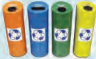
Rİ 17 İç Mekan 4'lü Geri Kazanım Seti