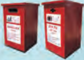
Telikeli Atık ve Atık Pili Kumbarası