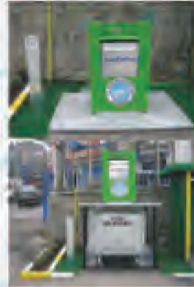
Yeraltı Çöp Konteyneri