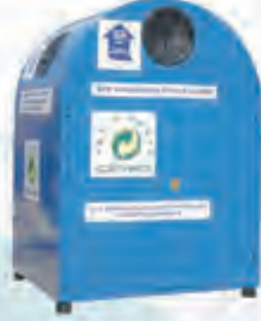
RD 15 Dış Mekan Geri Kazanım Kumbarası