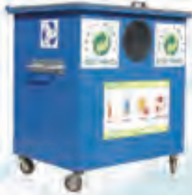
RD 1000 Dış Mekan Geri Kazanım Konteyneri