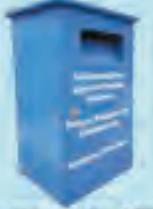
Kullanılmış Elbise Toplama Konteyneri