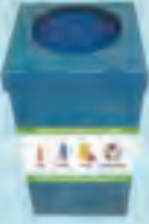
Rİ 10 İç Mekan Geri Kazanım Kumbarası

İMOT EKOLOJİK DENGİNİN SAĞLANMASI KONUSUNDA SİZLERİN EN BÜYÜK DESTEKÇİSİDİR.