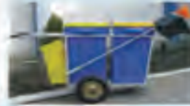
Rİ 17 İç Mekan 4'lü Geri Kazanım Seti