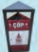
Uzay Tipi Çöp Kutusu